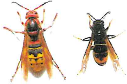
Frelon commun (jusqu'à 4 cm) Frelon asiatique (jusqu'à 3 cm)